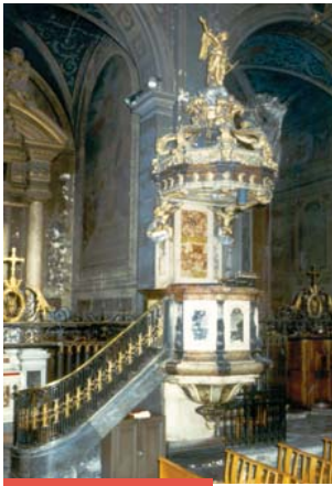
CHAIRE À PRÊCHER Marc Chabry II

L'intégralité du bâtiment et du mobilier est classée "Monument Historique". Ces merveilles sont cependant cachées sous une épaisse couche de poussière.