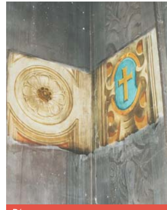
DÉCOR DE LA CHAPELLE Alexandre Denuelle - XIXème siècle Résultats des sondages réalisés en 2007

Des événements religieux mais également des concerts pourront à nouveau être organisés dans ce joyau baroque dont l'architecture trouve des échos dans toute l'Europe et notamment en Italie.