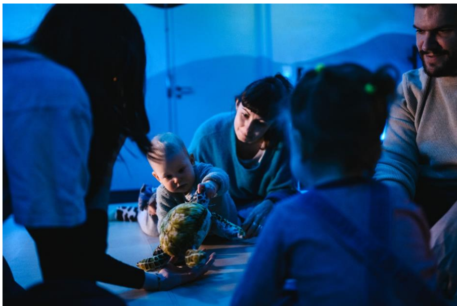
Atelier Sous l'océan

Parce que le soin passe aussi par la culture, ce dispositif contribue à renforcer la relation parent-enfant et à promouvoir une santé globale, émotionnelle et sociale dès les premiers jours de vie.