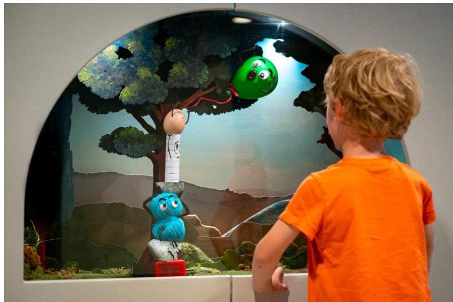
Le Nuage des petits

« Les musées contribuent à former les citoyens de demain. Nous savons tous, par nos propres souvenirs, combien la visite d'un musée, la mise en présence d'une œuvre ou un témoignage de la nature peuvent nous accompagner pour la vie. Nous souhaitons ouvrir aux plus jeunes, telles des portes magiques, celles qui conduisent à l'émotion, à l'imagination et à la curiosité. Pour beaucoup d'enfants, le musée des Confluences est devenu « leur musée », un musée de cœur, un musée du quotidien. La création du Pass Colibri marque une nouvelle étape pour un établissement tourné vers la jeunesse, aux côtés des Hospices Civils de Lyon, eux aussi engagés pour le soin et la parentalité. » - Hélène LAFONT-COUTURIER, Directrice générale du musée des Confluences