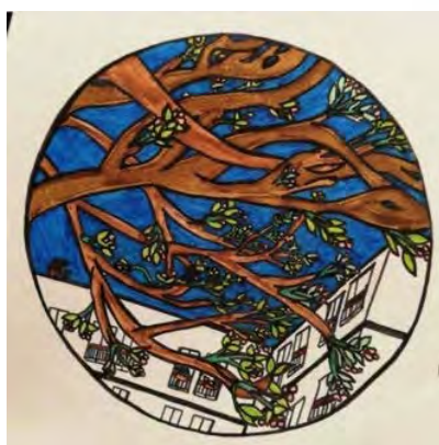
Agath, Paris – France