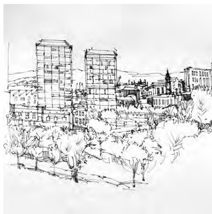
Liz Reid, Glasgow - Ecosse