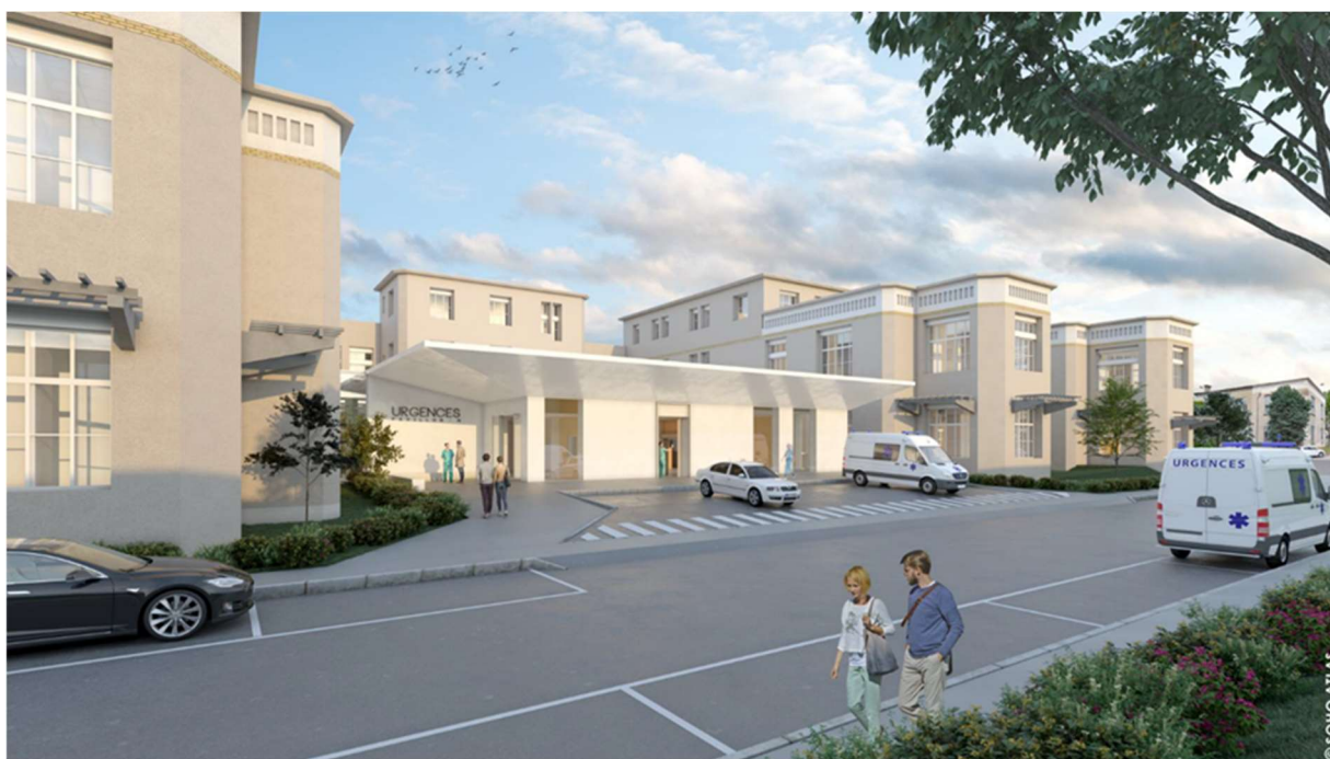
Vue d'architecte de la future entrée du pavillon N

Un déménagement provisoire de 18 mois qui permettra au pavillon N d'être entièrement modernisé avant d'accueillir définitivement l'ensemble des services d'accueil des urgences chirurgicales et médicales (pavillons A et G). Une opération tiroir qui permet l'amélioration et la sécurisation des prises en charge, de la qualité des soins, de l'accueil des patients et des conditions d'exercice des professionnels. Cette réorganisation constitue le dernier volet de la phase 1 du projet de modernisation de l'hôpital Edouard Herriot lancé en 2013, qui comprenait également le regroupement de l'imagerie au pavillon B et le regroupement du plateau technique (blocs opératoires et lits de soins critiques) de l'hôpital au sein du nouveau pavillon H.