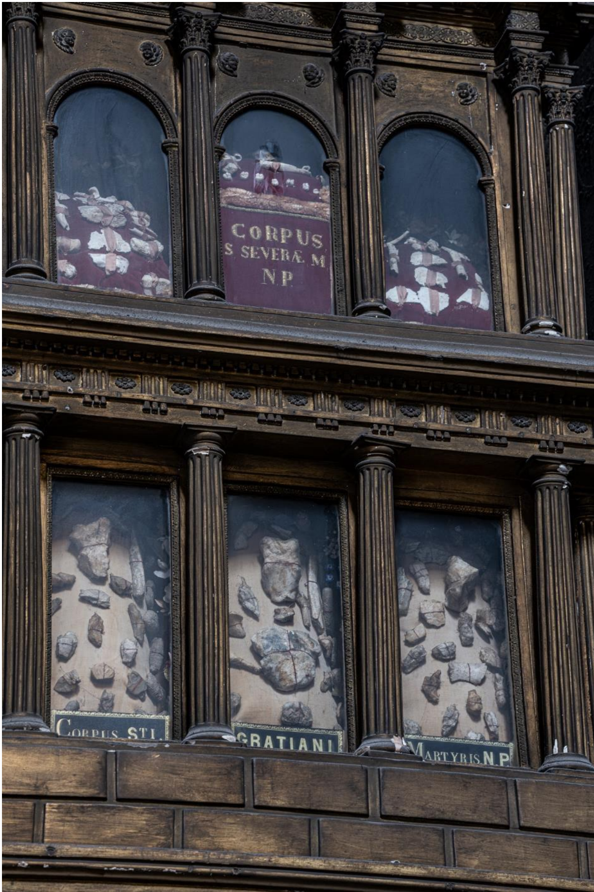
Hospices Civils de Lyon — Mission Culture et Patrimoine Historique Chapelle de l'Hôtel-Dieu — Place de l'Hôpital, 69002 Lyon